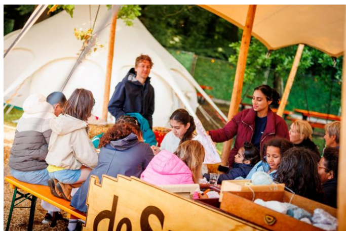
Leerlingen van de IMC Weekendschool